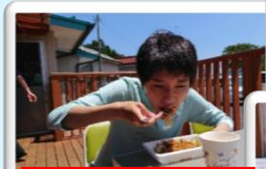
外で食べると、とてもおいしいです。