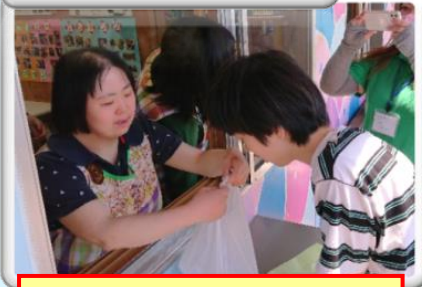
焼きそばとフランクフルトをみんなに振舞いました。