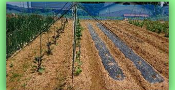
なす・きゅうり・オクラ他