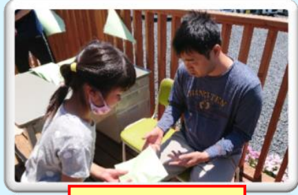
ゲームの景品ももらいました。