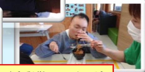
お昼は、焼きそばとフランクフルトをお腹いっぱいいただきました。