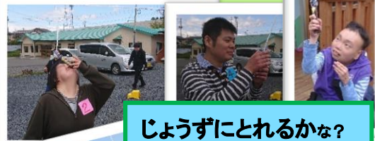
じょうずにとれるかな?