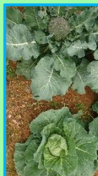
キャベツ ブロッコリー