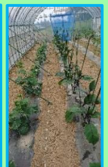
トマト キュウリ ナス