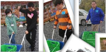
一輪車でレッツゴー