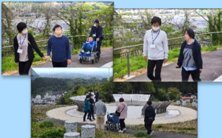
気仙沼復興祈念公園(陣山)