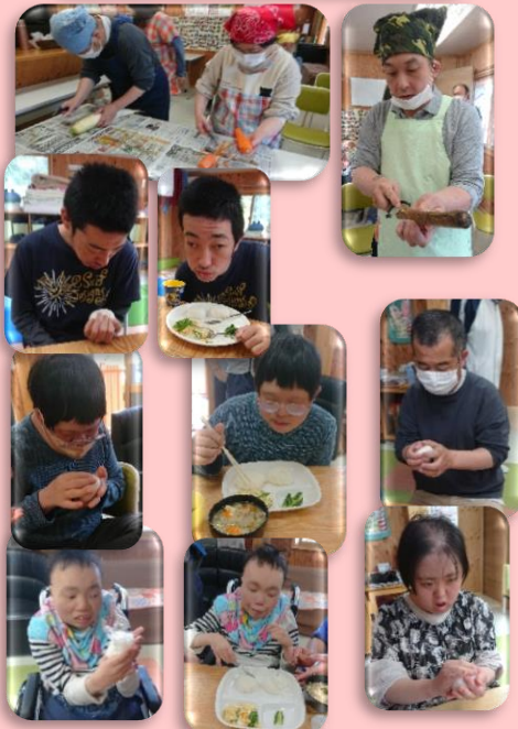
みんな上手ににぎれました。