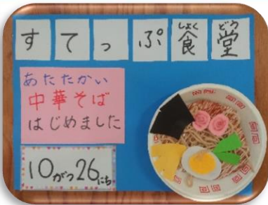
すてっぶ食堂では冷やし中華を終了し、あたたかい中華そばをはじめました。みんな残さずいただきました。