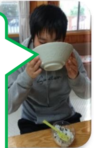
うまい!スープもせ んぐいいただきます。