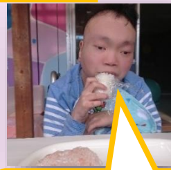
新米のおにぎりはおいしいね♡