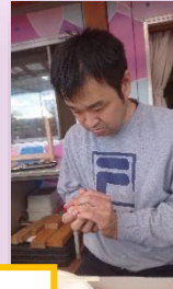
おにぎり上手にむすべました。