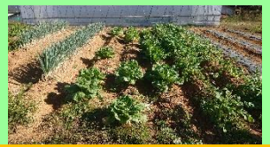
ネギ・はくさい・だいこん