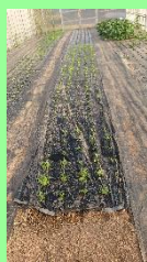
しゅんぎく・みずな