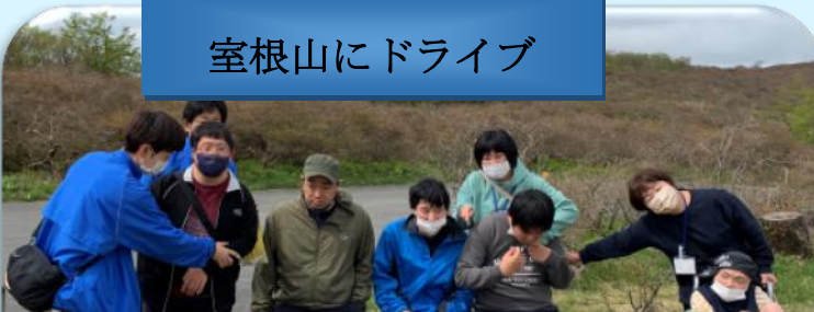
室根山にドライブ

ジャガイモ、玉ねぎ、カボチャ、トウモロコシ、ブロッコリー、ハウスのトマトやナス、キュウリなど順調に育っております。