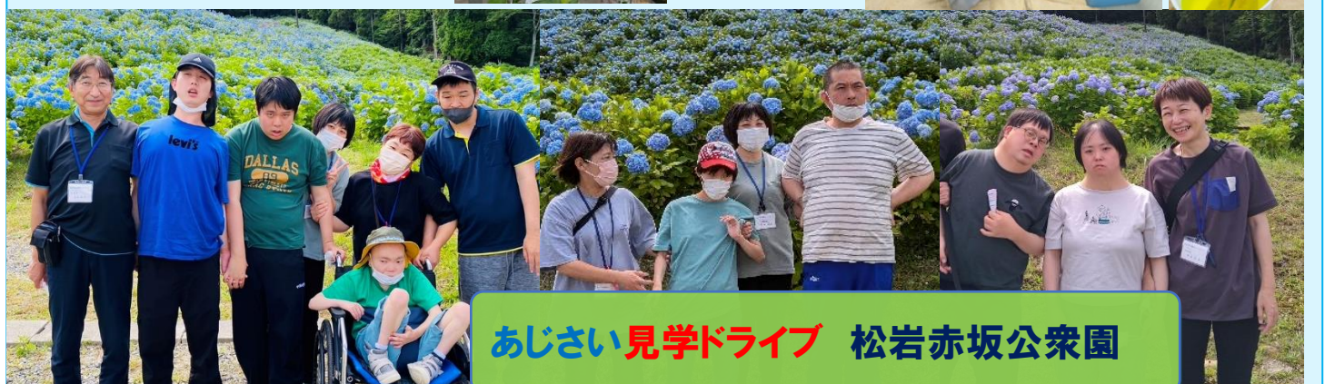
あじさい見学ドライブ 松岩赤坂公衆園