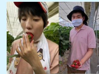
6月17日 足湯といちご狩り