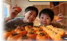
渋柿ってどうやって食べるの？