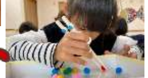
秋まつりのお手伝いしました！