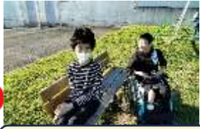
外遊びでみんな笑顔♡