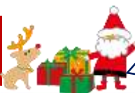
ミニ文化祭 展示作品