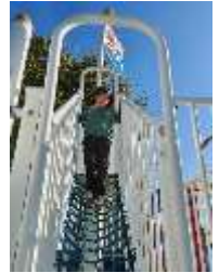
みんな仲良しです♪