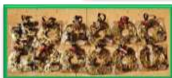
クリスマスリースを作りました♪